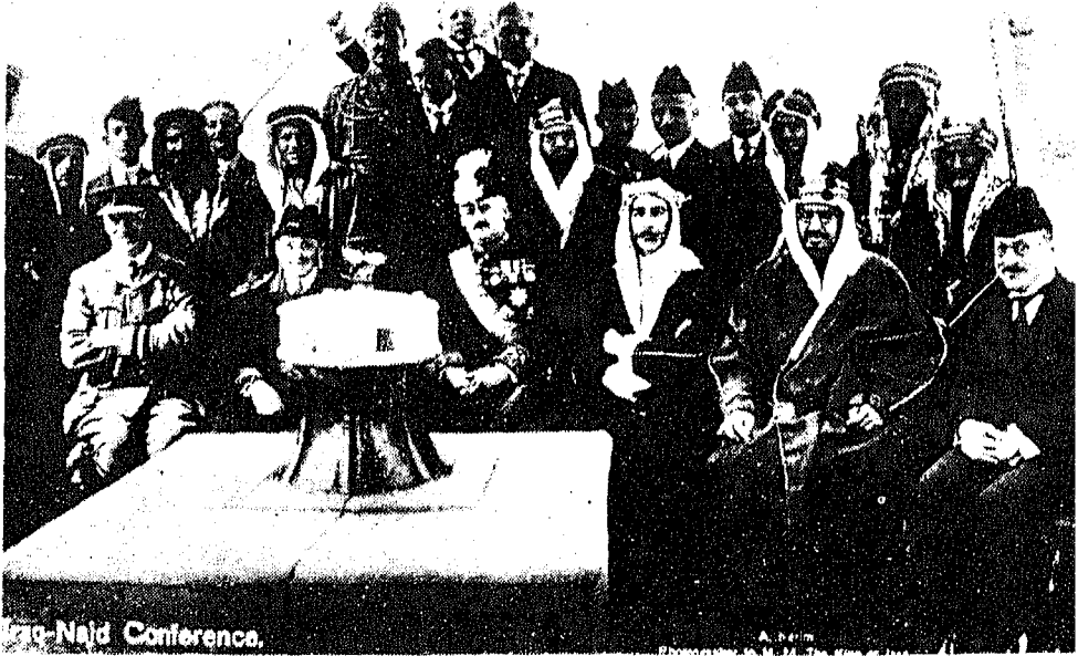
الاجتماع في الباخرة "الوين"

وأنه لا مانع من البحث. فالتفت الملك فيصل إلى رئيس وزارته يؤتبه. واستعمل الملك عبد العزيز لباقته في الموضوع، فقال: إن الأمر متروك لجلالة الملك فيصل إن شاء البحث بُحث وإن شاء تُرك لمندوبي الحكومتين. فاقترح فيصل أن يحال البحث إلى مندوبي الدولتين للتداول فيه. فانسحب مندوبو الحكومتين إلى جانب من جوانب الباخرة. ووضعوا "مشروع معاهدة صداقة وحسن جوار" كما وضعوا مشروعاً لمعاهدة "تسليم المجرمين" ولكن الاتفاق لم يتم نهائياً على المعاهدتين، بسبب الاختلاف على تعريف المجرم السياسي، ورغبة الجانب العراقي في عدم تسليم "ابن مشهور" في حين أن الحكومة البريطانية كانت متعهدة بتسليم جميع العصابة الذين كانت تطاردهم القوات السعودية.